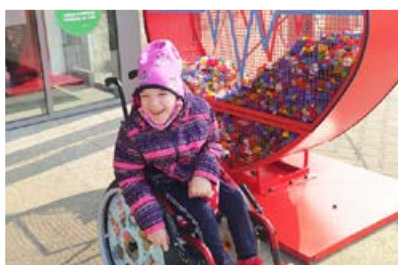
Mamy swoje serce!