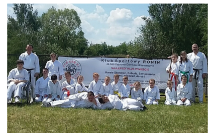
Strzemieszycze sportem stoją