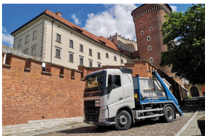
DSS Recykling na Wawelu