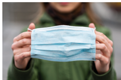
Wspólnie walczymy z pandemią