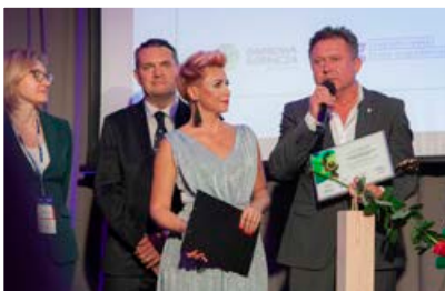
Business MeetUp 2022