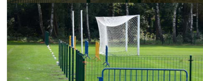
Montaż piłkochwyłów i nowego ogrodzenia na stadionie przy ul. Sportowej