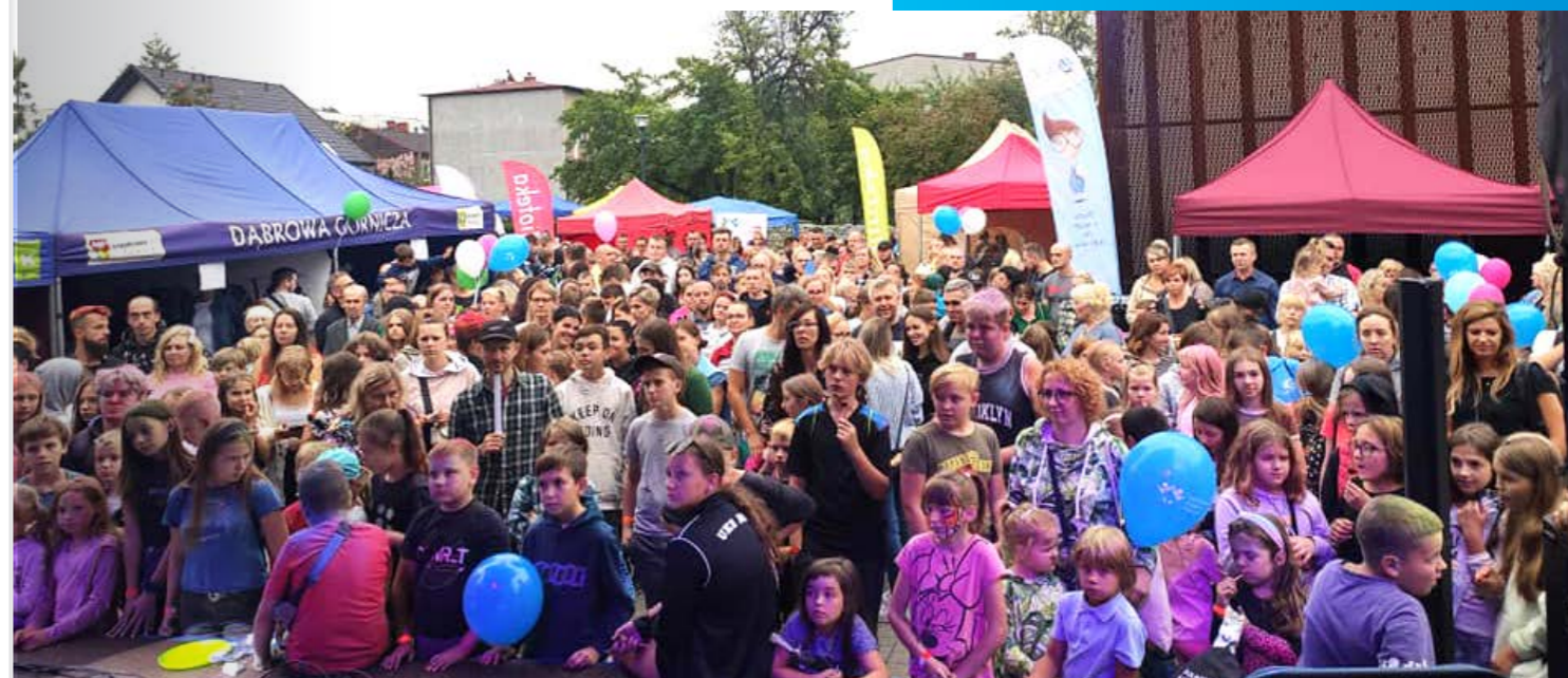
Fot. Fila nr 8 MBP w Dąbrowie Górniczej