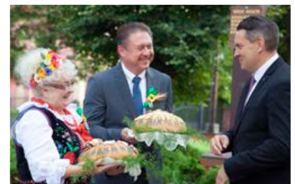
Dożynki w Strzemieszycach