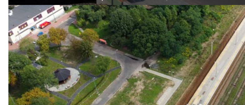
Tężnia gotowa, teraz pora na tunel pieszo-rowerowy pod torami