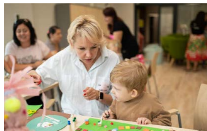
Babskie Klacze – rodzinne warsztaty Zero Waste