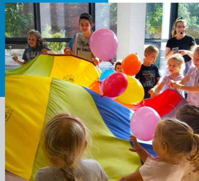
Lipcowe piątki z animacjami