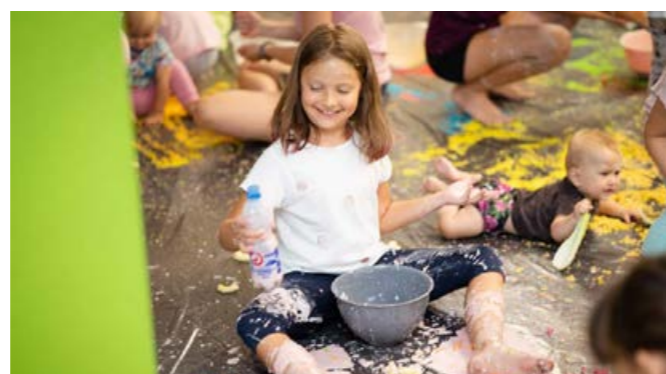
Babskie Klacze – sensoplastyka dla dzieci