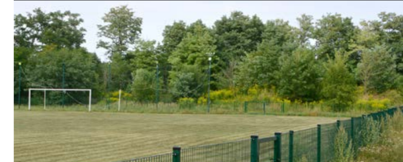
Nowe ogrodzenie wokół boiska w Strzemieszycach Małych