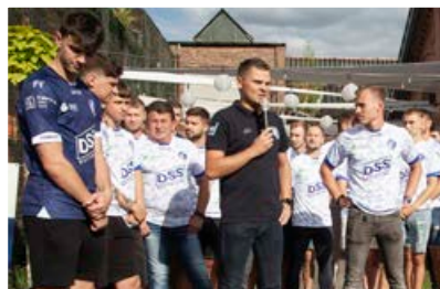
Prezentacja drużyny KS UNIA