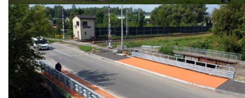
Nowy most nad Rakówką